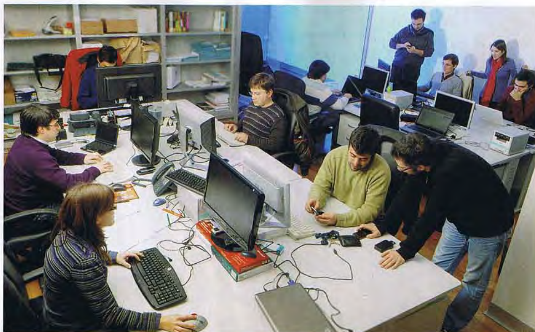
Na tecnológica de Braga procura-se equilíbrio entre a liberdade e o espírito de equipa