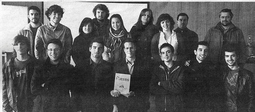
Grupo que alunos que concebeu a solução Flexes

Flexes é uma solução para gestão de seguros flutuantes, que faz a integração de dados com as aplicações existentes no mercado actual. A aplicação à medida, desenvolvida em parceria com a empresa Sagseg, pos-