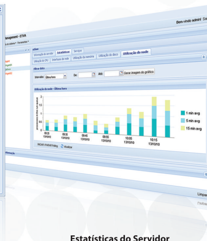
Estatísticas do Servidor